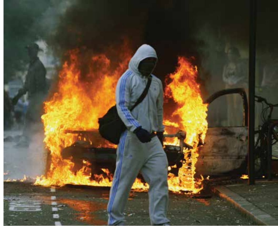
Şiddete karşı savunmasızlık, evrensel bir konudur. Londra, Ağustos 2011’de isyanlara ve yağmalamalara maruz kalmıştı.

Özellikle bazı ülkeler silahlı çatışmalardan ciddi oranda etkilenmiş olsalar da dünyanın her yerindeki insanlar, yaşamlarında güvenliksizliğe maruz kalıyorlar. Barış, adalet ve yönetimle ilgili tüm hedefler, bazı Üye Devletlerin “özel durumlar” olarak adlandırdıklarının ötesine bakabilmeli ve yurttaşların korkudan uzak olmalarının tüm ülkelerde desteklenmesini sağlamalıdır.