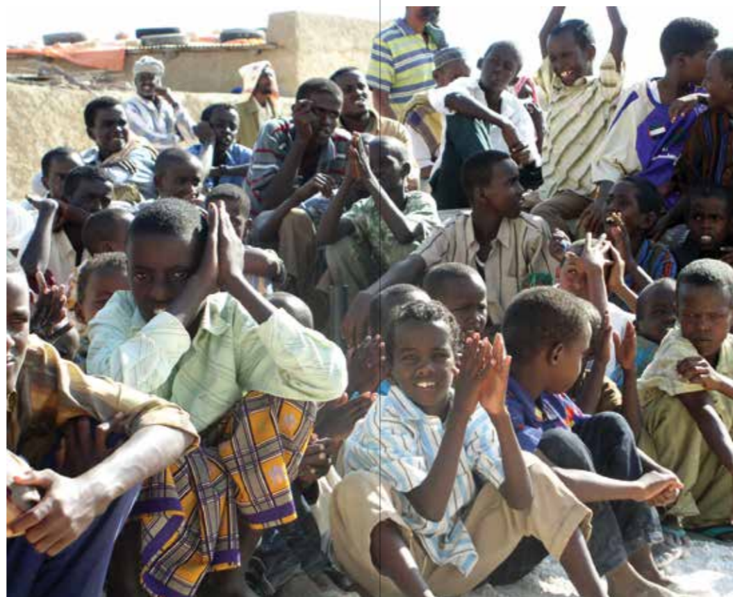
全世界的人们都将和平视为他们获得福祉的必要条件。年幼的男孩们在索马里首都摩加迪沙。