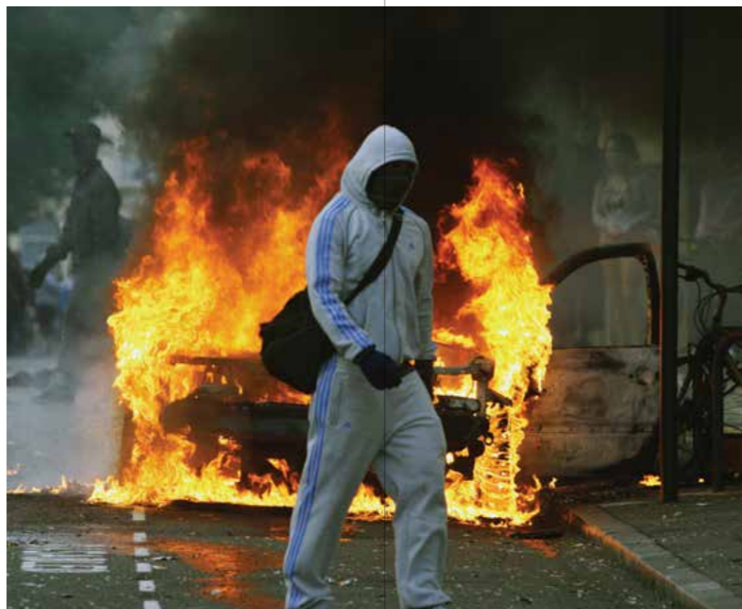
易受暴力侵害是一个全球性的问题：2011年8月，伦敦爆发骚乱，抢劫事件不断

和平、司法公正和治理问题的具体目标设置应使用具体成果，而非进程或能力，以明确相关目的和责任。虽然国家能力建设对创造和平社会发挥着至关重要的作用，在这个特定问题上的个别具体目标很有可能过于刻板，从而降低了框架的普遍性和反应不同国家背景的灵敏性。