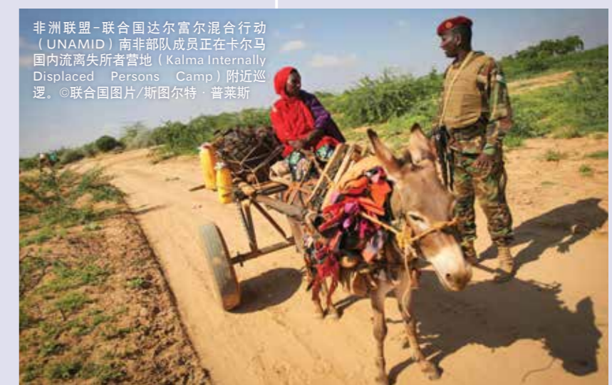
非洲联盟-联合国达尔富尔混合行动（UNAMID）南非部队成员正在卡尔马国内流离失所者营地（Kalma Internally Displaced Persons Camp）附近巡逻。